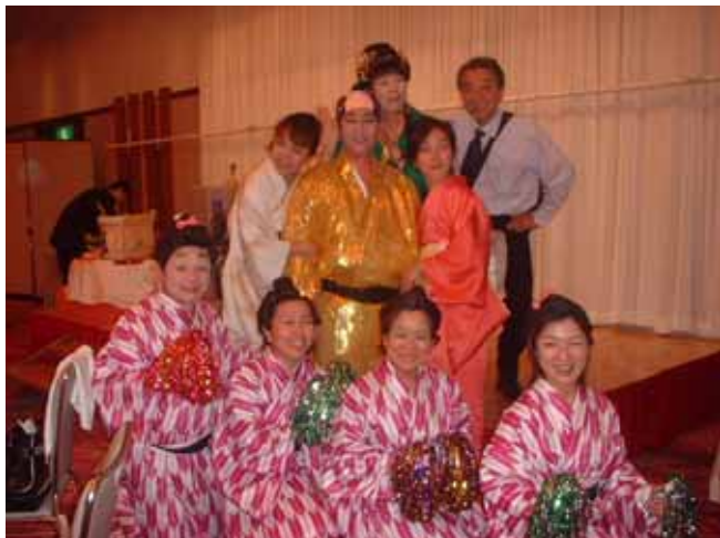
参加者：メン 23 名・メイト 4 名・ゲスト 2 名

と松ケンのサンパで会場全員が乗りのにった新年お笑い例会、これにて終宴。閉会点鐘、岡崎会長。