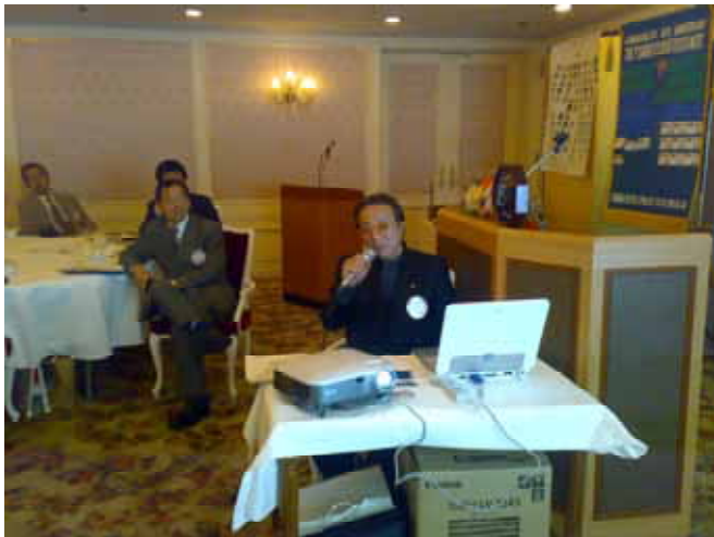
高野ワイズの講演

そうだ！理想は、他のエネルギーを使わず屋根にソーラー、ウイスキー古樽で雨水を使い、床下に、竹炭を敷き詰める。そう！高山邸宅に進めたいものだ。