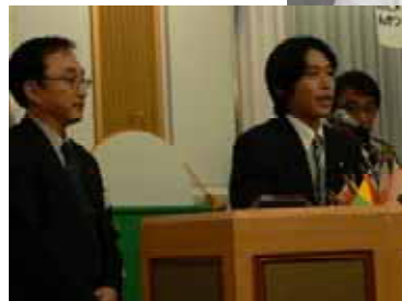
京都トップスクラブの皆様