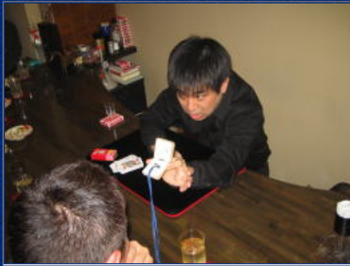
ほんで指輪ケースにしまって