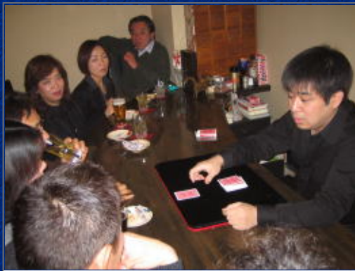
種がどこにあるのか？