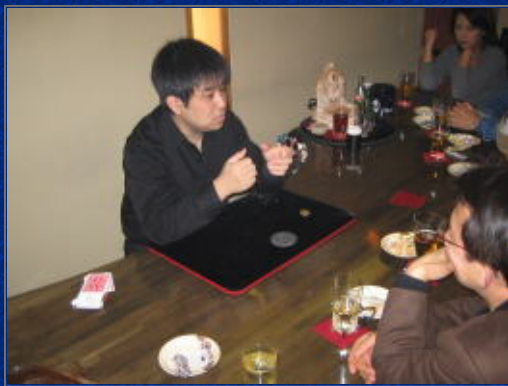
まだまだマジックは続きます