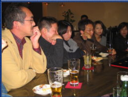
メンバーもお疲れ気味