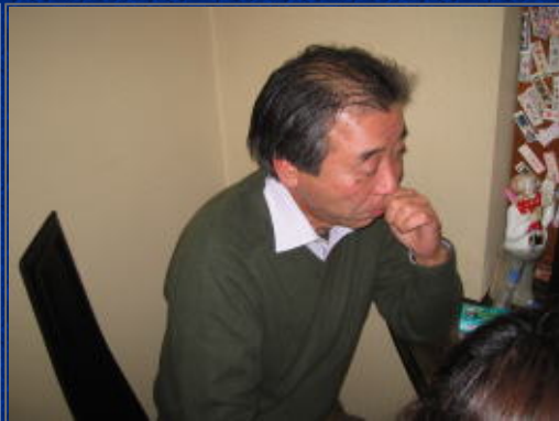
いい感じでお酒の入ったチョイ悪親父も唖然!