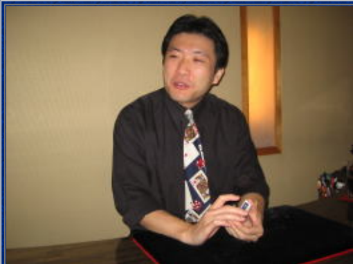
まずは最初のマジシャン登場

第一回目はテーブルマジックのお店！至近距離でマジックを披露していただきましたが素晴らしい職人芸に皆、唖然...「え？」「何で!？」の連発！1時間でしたが非常に楽しい時間でした。二次会は富永町花見西入の「ぱくぱくのはなじ」で宴会！美味しい料理とお酒で、ウエストクラブについて、提案、不満、希望などメンバーのいろいろな意見が飛び交い何か熱い楽楽会でした。少人数でしたが盛り上がって結構、面白かったです！今回参加されていないメンバーの方は次回は是非ともご参加下さい!!! ちなみに三次会はお決まりの不良中年トリオで豪遊！しかも隊長のおごり！ いや~(汗)またやってしもた~