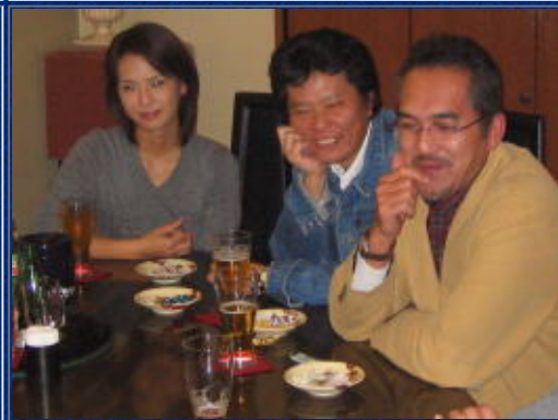
あ～さっぱりわからん！？何で～