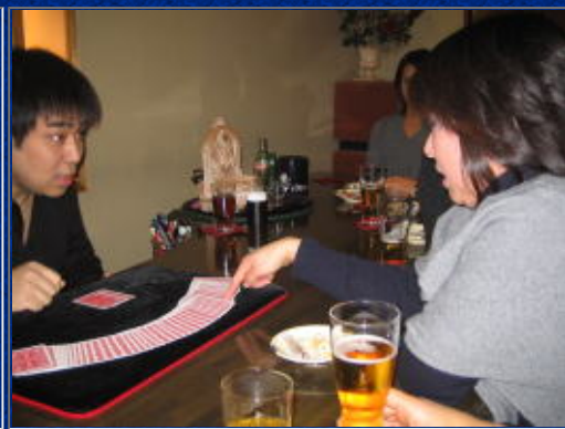
中原メネットも挑戦！まずは選んで