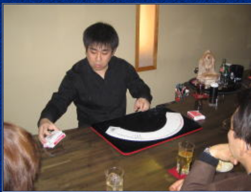
絶妙なトークと手さばき！さすがどす