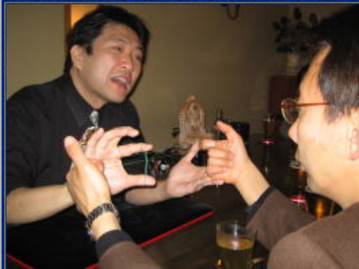
単純なマジックに山下Y'S 唖然!