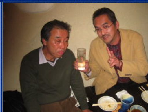
盛り上がりました