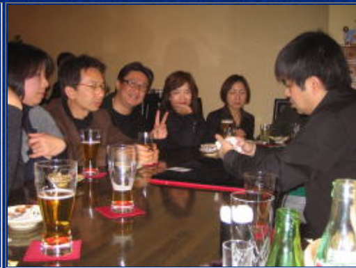
真剣に見てんにゃけど