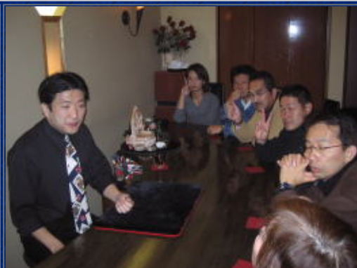
見破る気満々のメンバー同