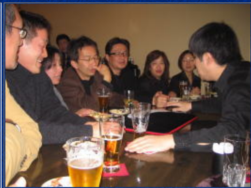
中原会長の指輪を使って