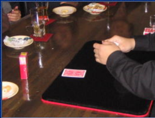
のおまけの中から指輪が出てきました