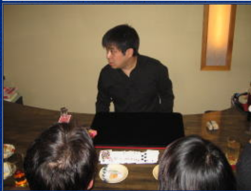
すごいマジックの連発に