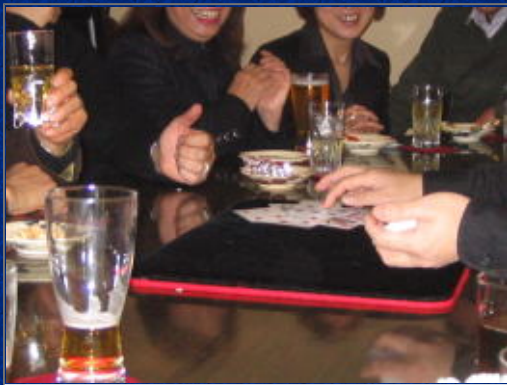
手元をアップして