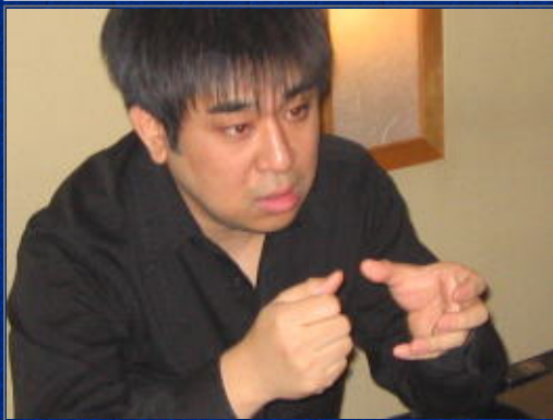
喜多さん曰く 「箱の中にあるちっちゃい