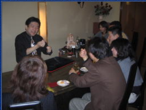
日用品を使っでのマジックが連発