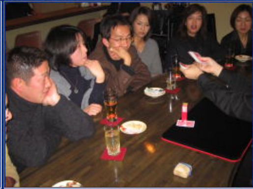
ほんでどうなんの??