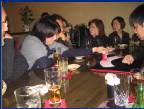
いろいろやって最後にこのグリコのお菓子