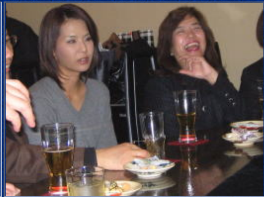
訳わからん!しかし、すごい