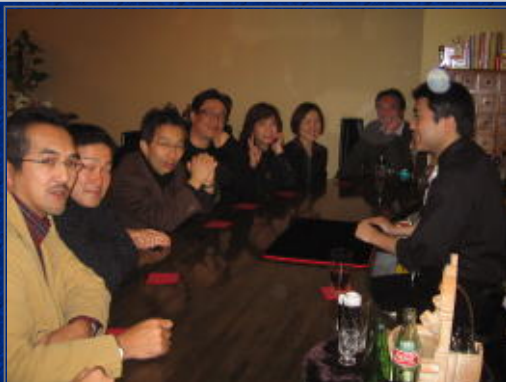
至近距離なのでマジックの種を