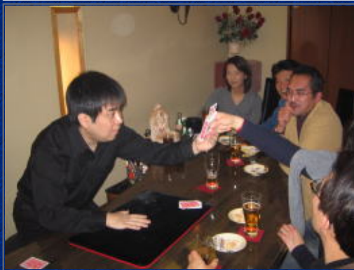
ゲ！何で箱から当りが自動的に出てくんの！