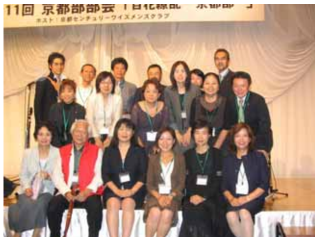
京都部会に参加したメンバー