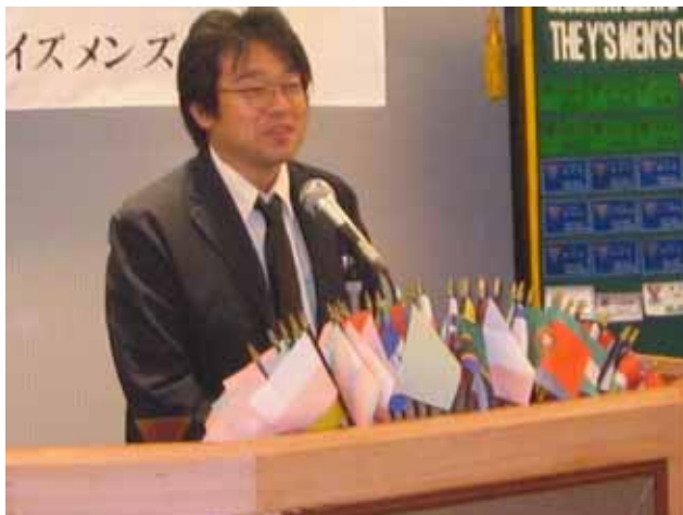
平安徳義会の勢力先生のお話

今回、最初から最後までメネットに例会の機会を与えてくださいました、会長はじめメンの皆様本当にありがとうございました。