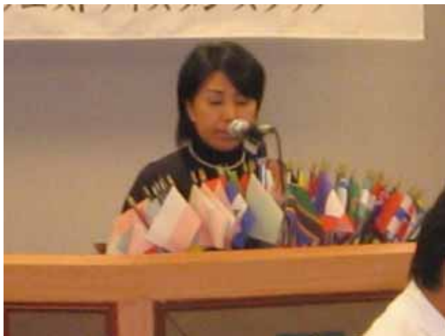
中原メネット会長の挨拶