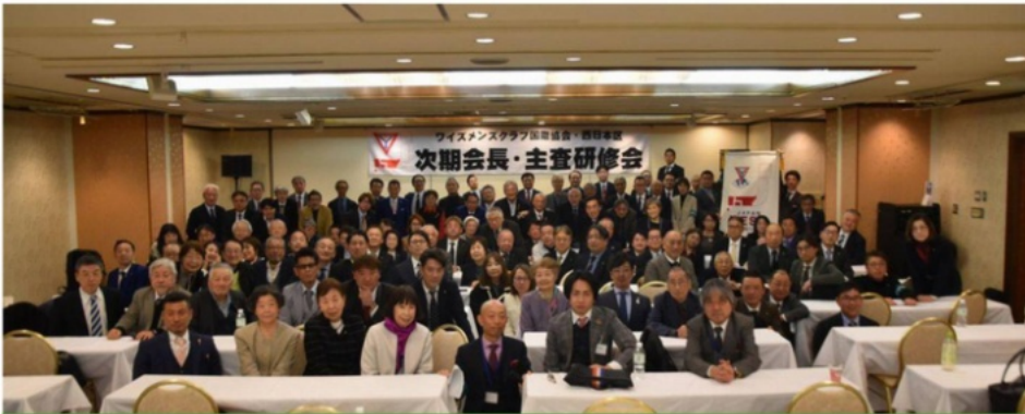
2025年度 次期会長・主査研修会 2026年3月7日 ホテルクライトン新大阪