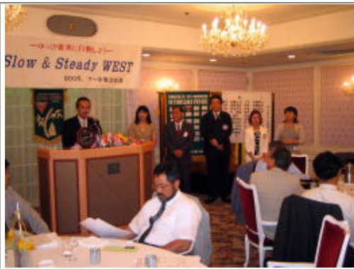
会長&三役、所信表明