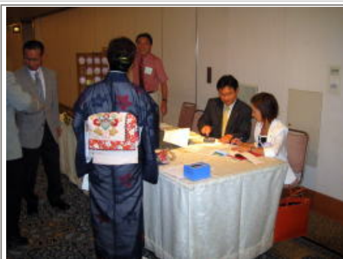
リーガロイヤルに変わりました。