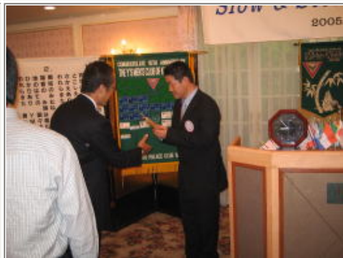
ハッピーアニバーサリー