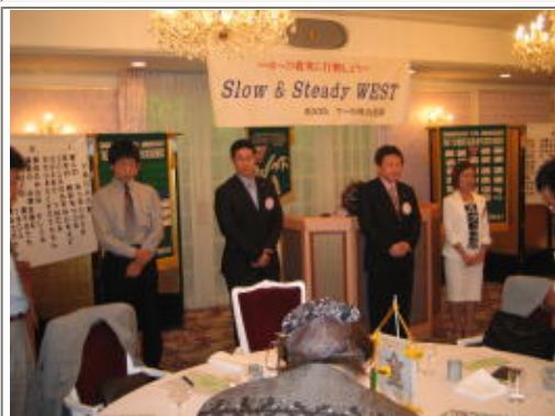
ハッピーバースデー