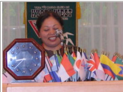
大西地域奉仕委員長