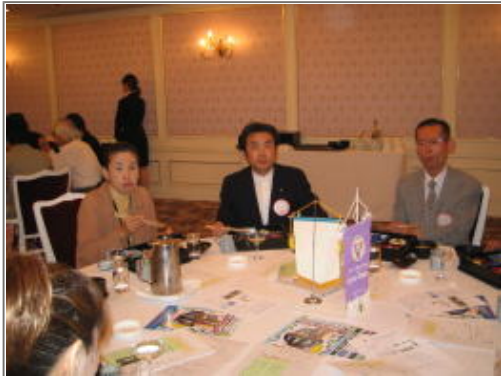
和やかな雰囲気、たん熊の松花堂弁当を美味しくいただきました