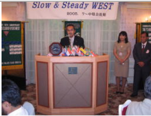
トップバッター中塚会長