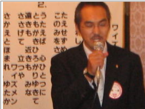
中原メネットニコニコ