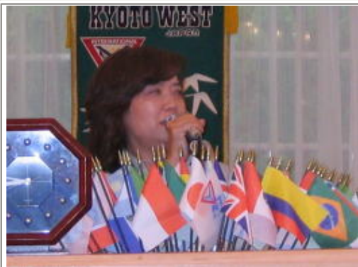
桂ドライバー委員長