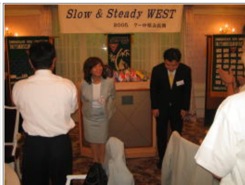
盛大な拍手！メンバー増強がんばろ～