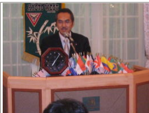
中原会長のご挨拶