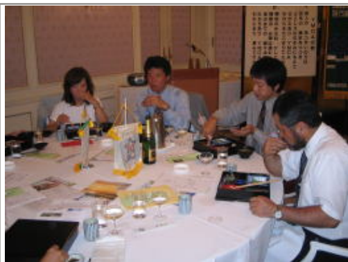
シャンパンで乾杯後、お食事