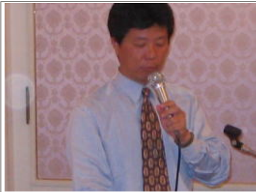
次回例会アピールの藤居Y'S