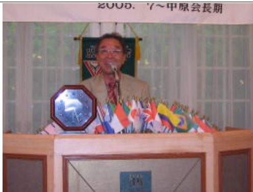
お次は事業委員長、胡内Yサ委員長