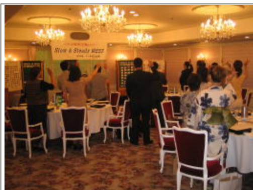
ウイズソング斉唱