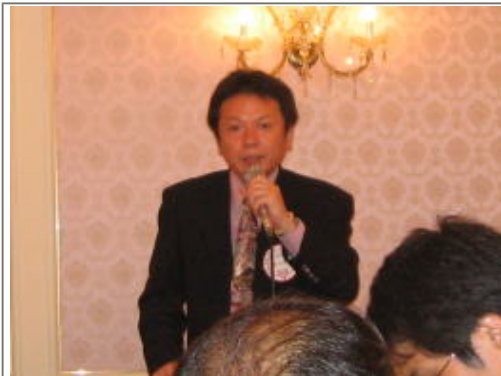
これよりニコニコタイム