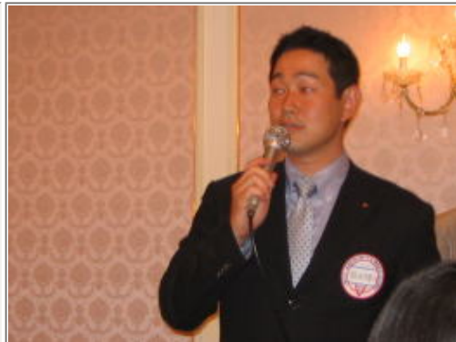
ニコニコマンの大野Y'S