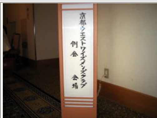
今期より会場がガーデンパレスから