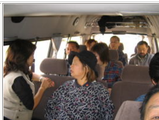
大野ワイズ色々段取りお世話になりました。