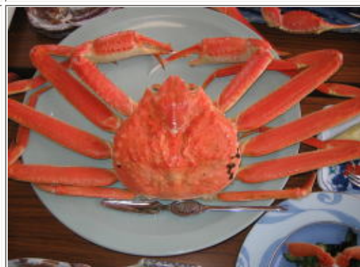
松葉ガニがドーン!!