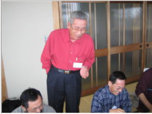
しかしお腹がおさまってくると...