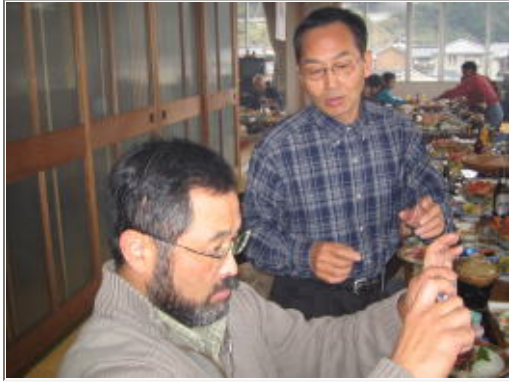
飲んで喋ってる場合とちゃうやん！