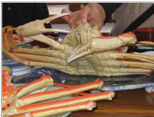
うわ! 生きてる! 生きてる??