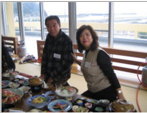
メンバーですが、開始前半はカニを