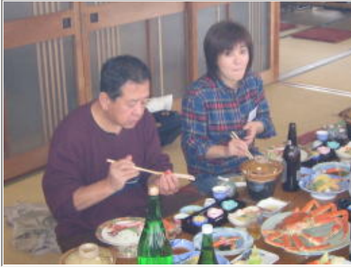
取り合えず食うべし！と、