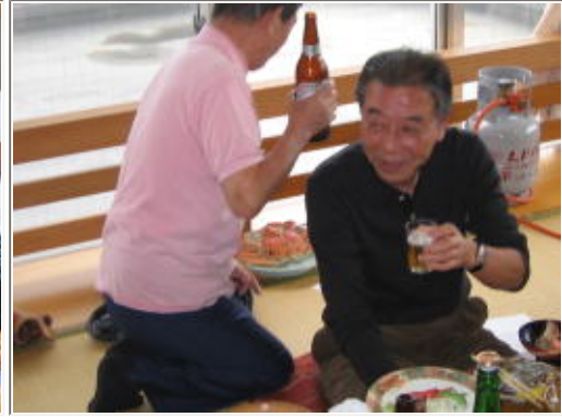
うるさいわ、のウエストに逆戻り