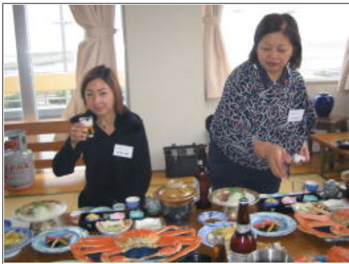
いつも賑やかなウエストの