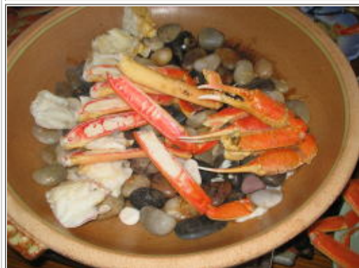
焼きガニがドドーン!!!