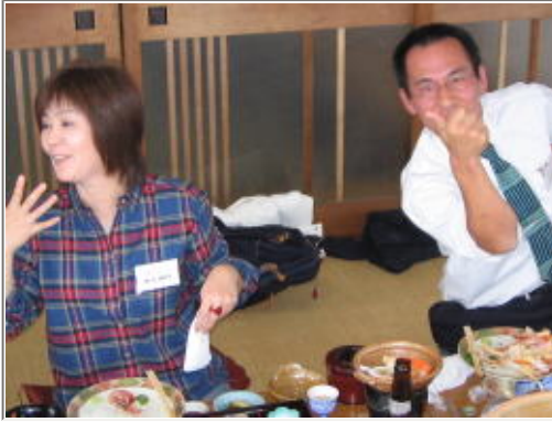
しゃべるわ、飲むわ