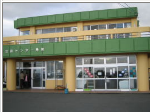
5時間かけてやっと到着(涙)