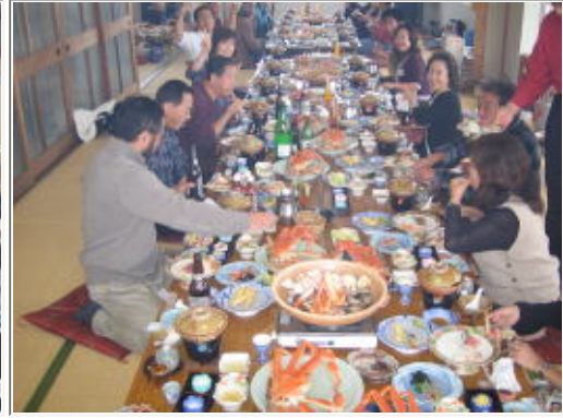
会話のキャッチボール少ない少ない (笑)