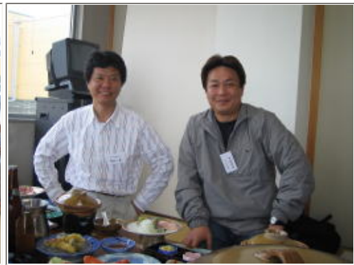
前に黙々と食べる、食べる