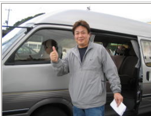
で快適な移動ができました。