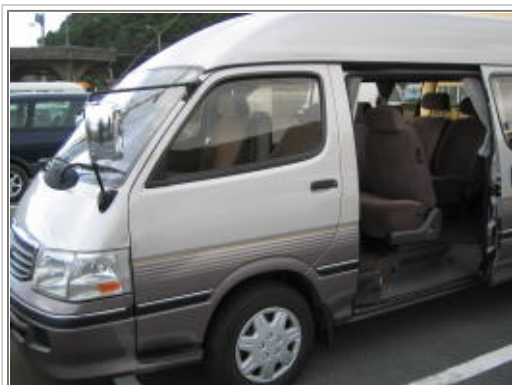
ハイエスロングハイルーフ10人乗り

しかし高速道路、事故の為の中国道通行止めで急遽、ルート変更。ひたすら9号線 を走り5時間かけて到着。鳥取ワイズメンズクラブの皆様、遅れて申し訳ありませんでした。