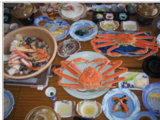
豪華カニ尽くし料理!!