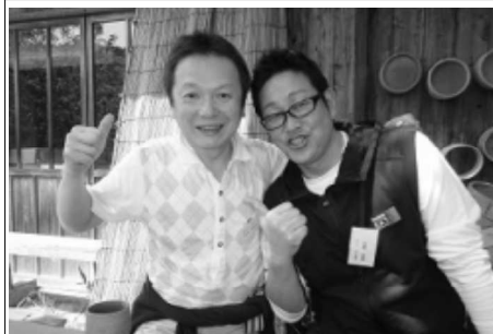
4/29 大阪西 木器窯交流