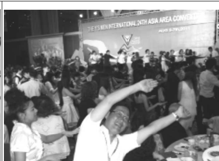
8/4-7 アジア大会 (台北)