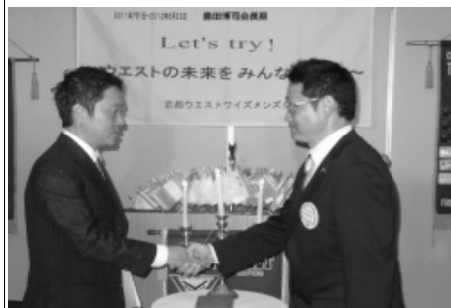
11/20 EMC例会 吉川ワイズ入会