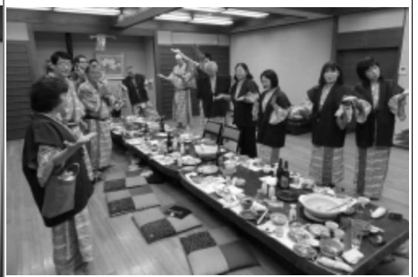
3/3 一泊例会 (日間賀島)