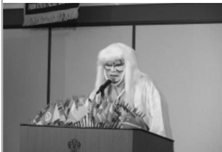
1/7 三クラブ合同新年例会