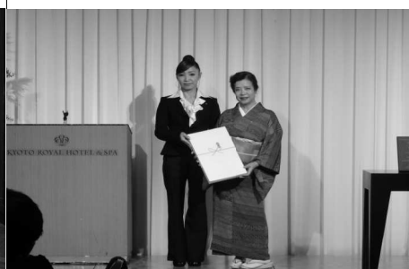
10/26 桂部長ILマーカウ賞祝賀会