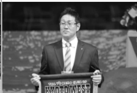
6/9 西日本区大会 (米原・長浜)