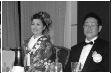
6/16 引継例会(サハラライズ 結婚式)