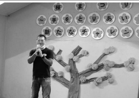
4/8 徳義会さくら祭り