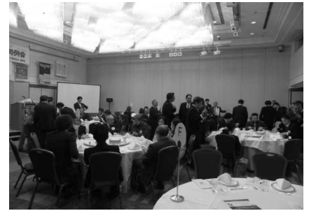
パレスクラブ平野会長