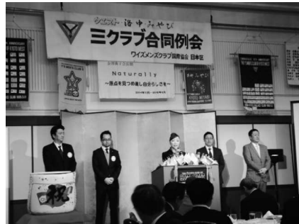
大阪西クラブ 畠平会長