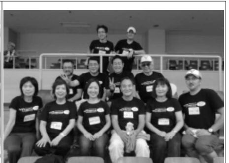
11/9 京都部部会 (福知山)